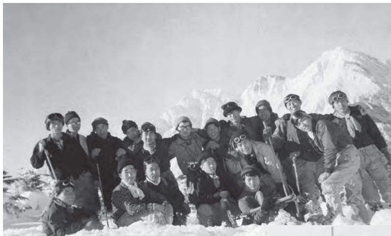
●左 37年、冬山 常念～徳本峠縦走合宿