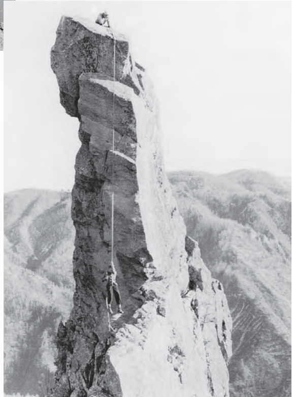
●右：烏帽子岩の懸垂下降