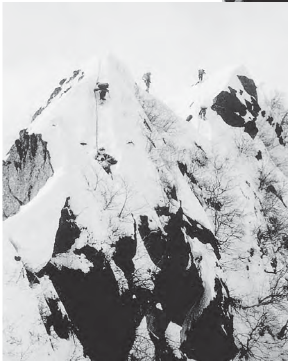
●左 34年、春山横尾尾根から槍ヶ岳横尾尾根「蟹の歯」を行く