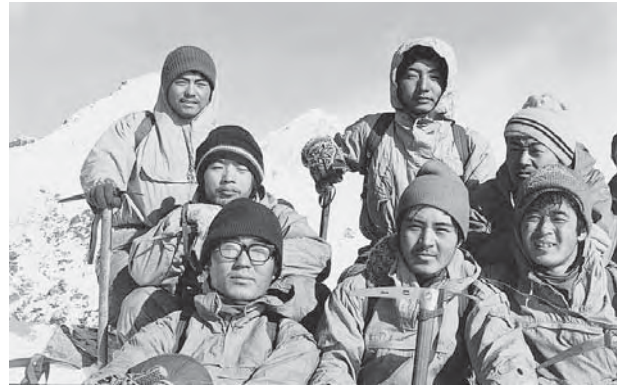
● 45年冬山西穂高ピークにて