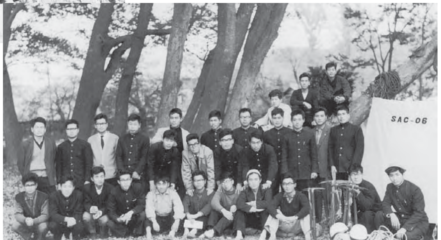
●右 35年にSACが結成され、大学 当局がテントを新調してくれた。 県の森で当時の山岳部一同。