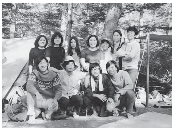
● 上 サマーテントにて