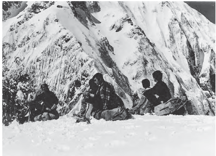
● 46年度春山鹿島槍ヶ岳 天狗尾根