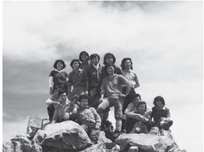
●49年 夏山合宿 剣岳山頂で